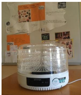
SUŠILEC SADJA, ZELENJAVE, ZELIŠČ

Nekatera zelišča posušimo in jih uporabimo za mešanice zeliščnih čajev, ki jih poklonimo našim obiskovalcem.